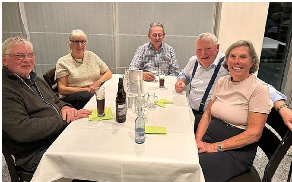
Afslapning hjemme på hotellet i Greifswald.